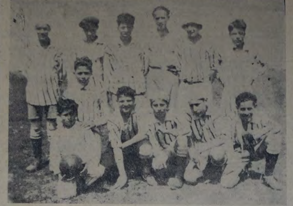
COMPONENTES DE LA QUINTA DIVISION DE LA JUVENTUD SOCIALISTA DE LANUS, QUE SE CLASIFICÓ campeón de la Confederación Juvenil Socialista.

Total . . . $ 88.284.20 Esta suma irá a engrasar las otras ya recaudadas a beneficio de las víctimas ocasionadas por los terremotos ocurridos en Mendoza.